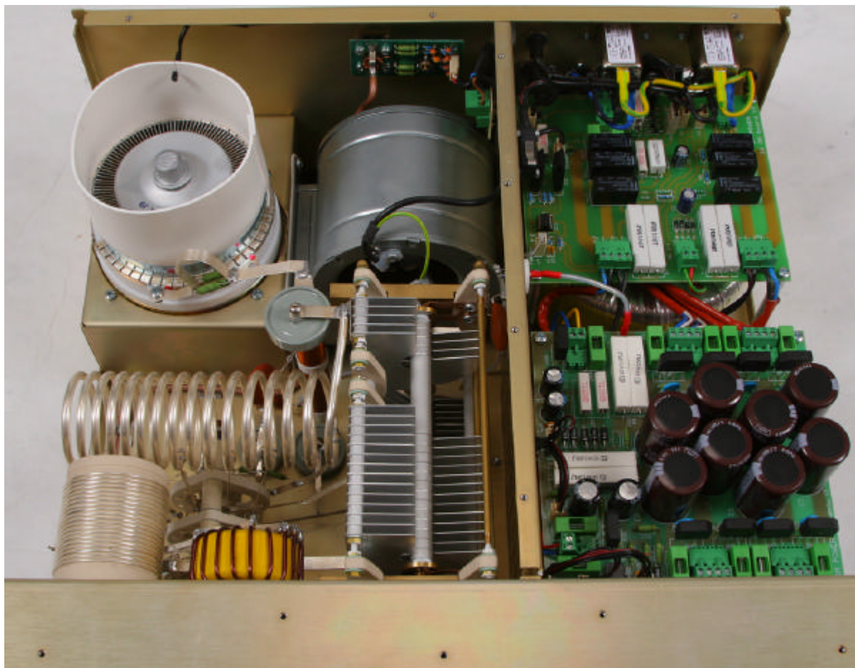
Vista da sopra ad amplificatore aperto